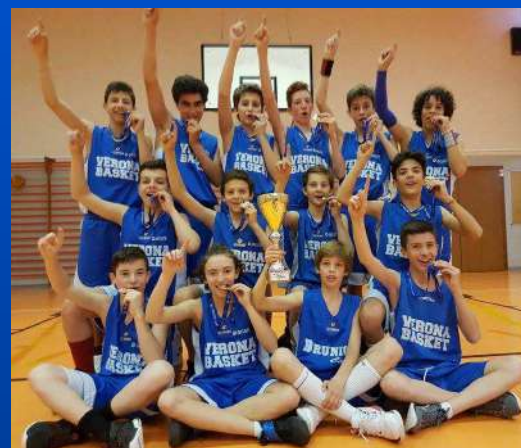
Under 13 Campioni Provinciali