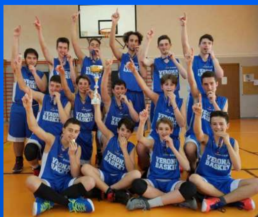
Under 15 Campioni Provinciali