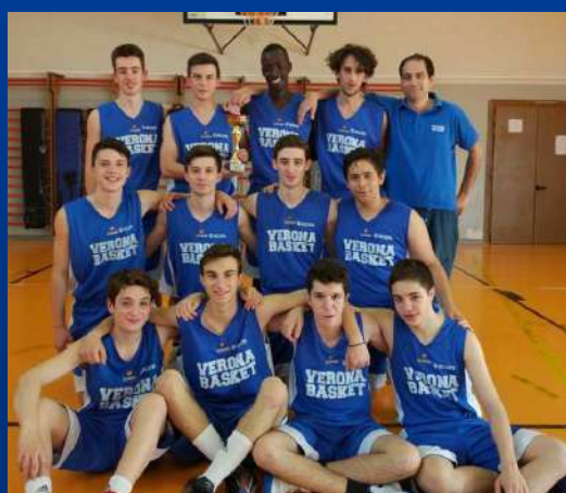
Under 16: 2° Classificati