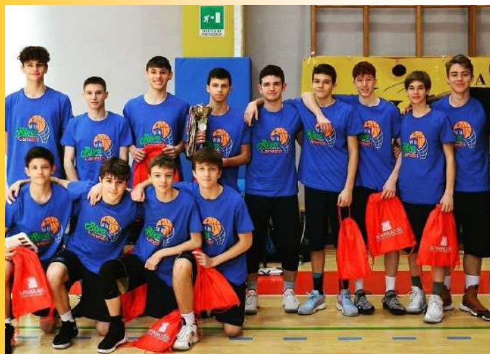
UNDER 16 VB - 1° classificati