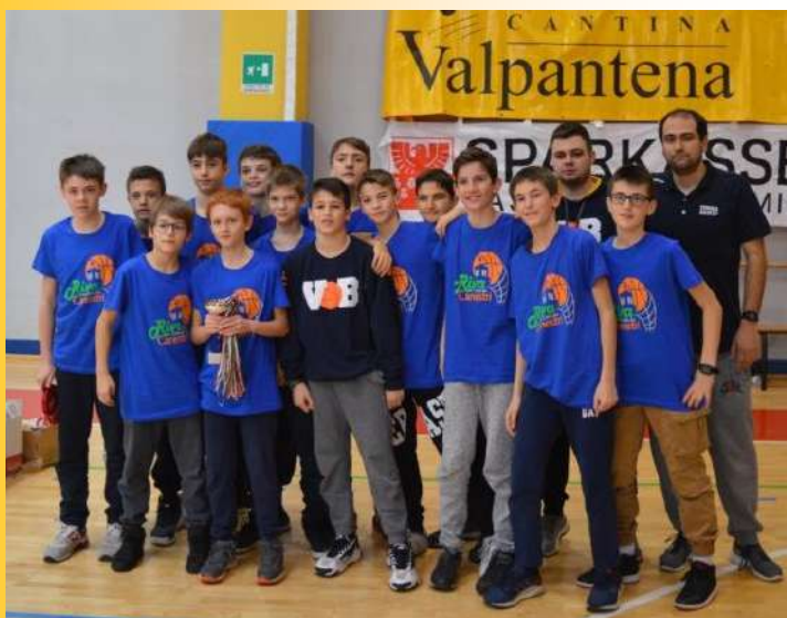
UNDER 13 VB - 2° classificati