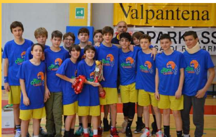
UNDER 14 VB - 2° classificati